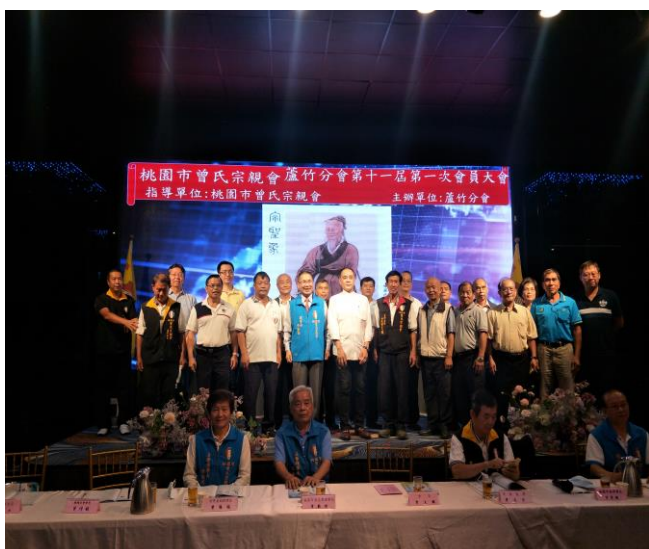
◆ 蘆竹分會 110 年度會員大會合影