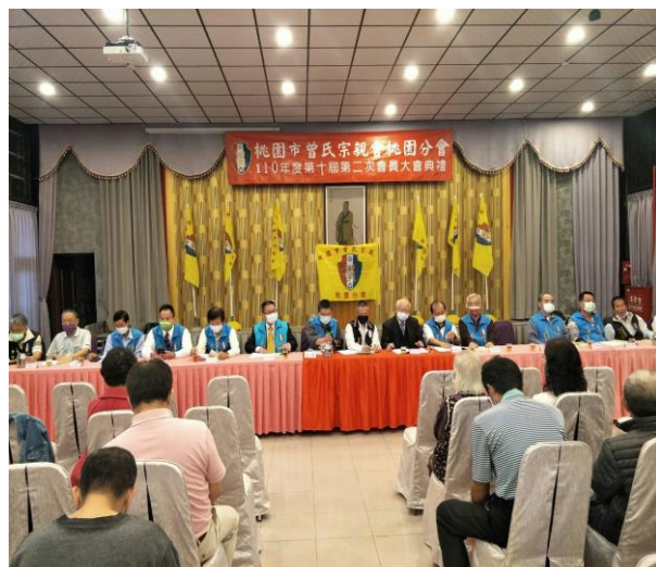
◆ 桃園分會 110 年度會員大會盛況