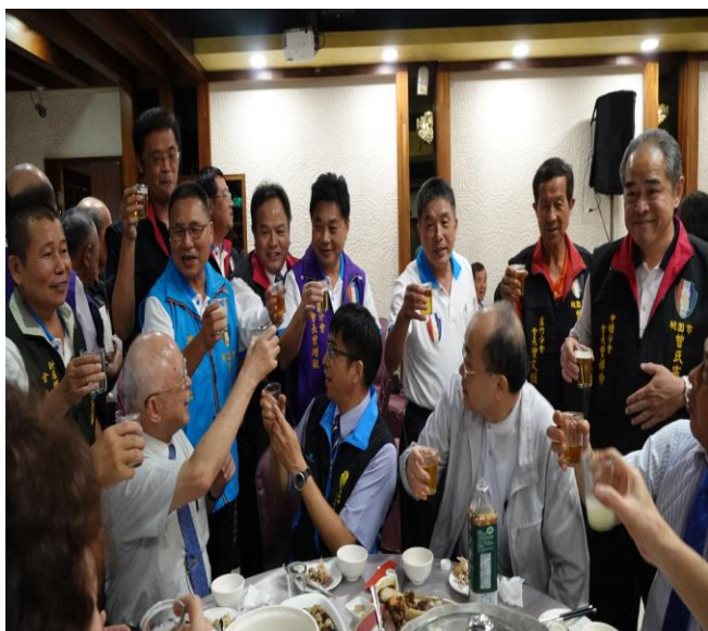
◆ 理事長率領各分會會長與貴賓敬酒