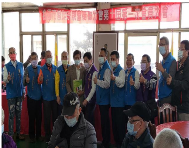
◆ 理事長率領各分會會長與貴賓敬酒