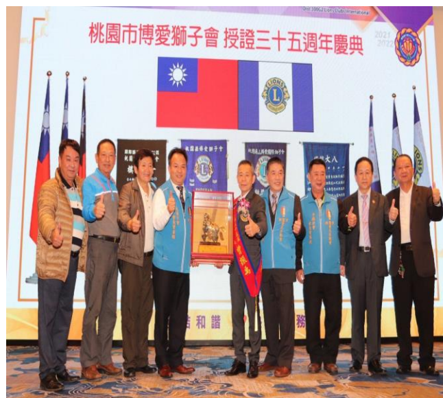
◆ 振禹理事榮膺桃園博愛獅子會會長