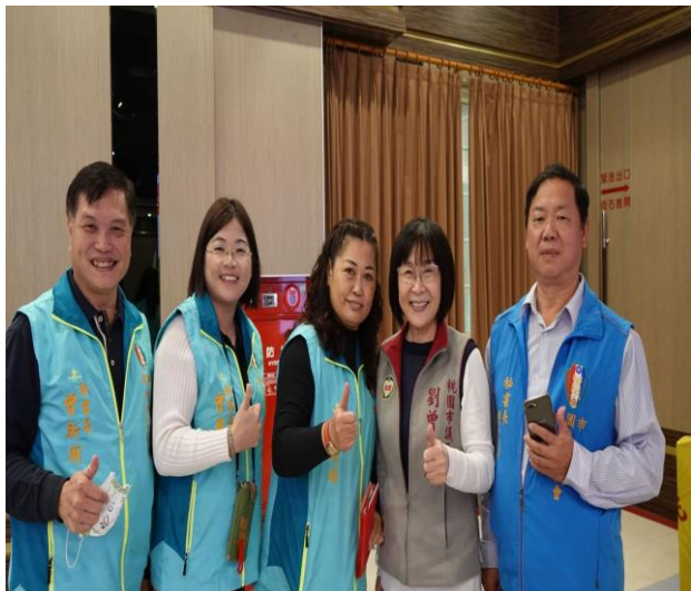
◆ 玉春市議員蒞臨市會大會活動合影