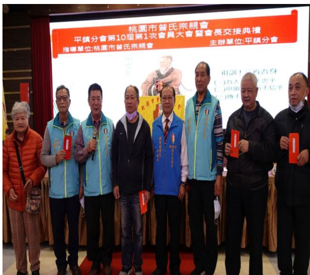
◆ 平鎮分會會員大會會長交接典禮