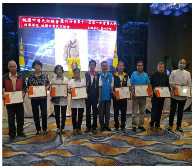
◆ 蘆竹分會會員大會頒發敬老金