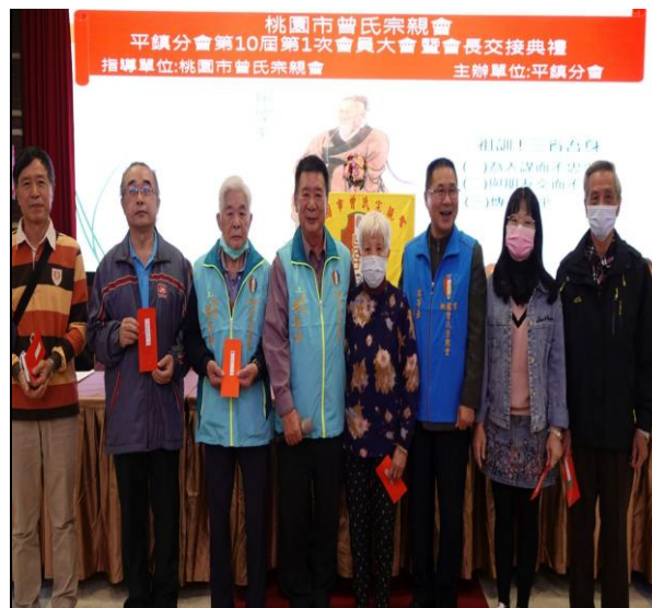
◆ 平鎮分會會員大會頒發敬老金