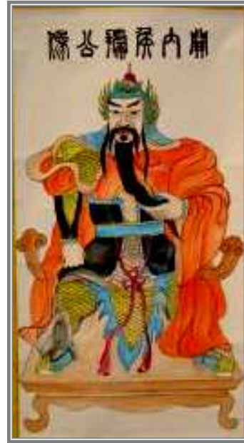
關內侯武城 15 派：前 10 曾據公像 公元(前 42~後 35)年

漢哀帝死亡（公元前 1 年），年僅九歲的平帝立，外戚王氏權力再起，王莽受詔輔政，以大司馬將軍總攬朝政，因功受封為「安漢公」。他利用機會收買人心，籠絡學者、士子上書歌功頌德。王莽見時機成熟，便弒平帝，立年僅二歲的孺子嬰為帝，自己攝政稱「假皇帝」。過了三年，受禪即天子位，改國號為「新」。