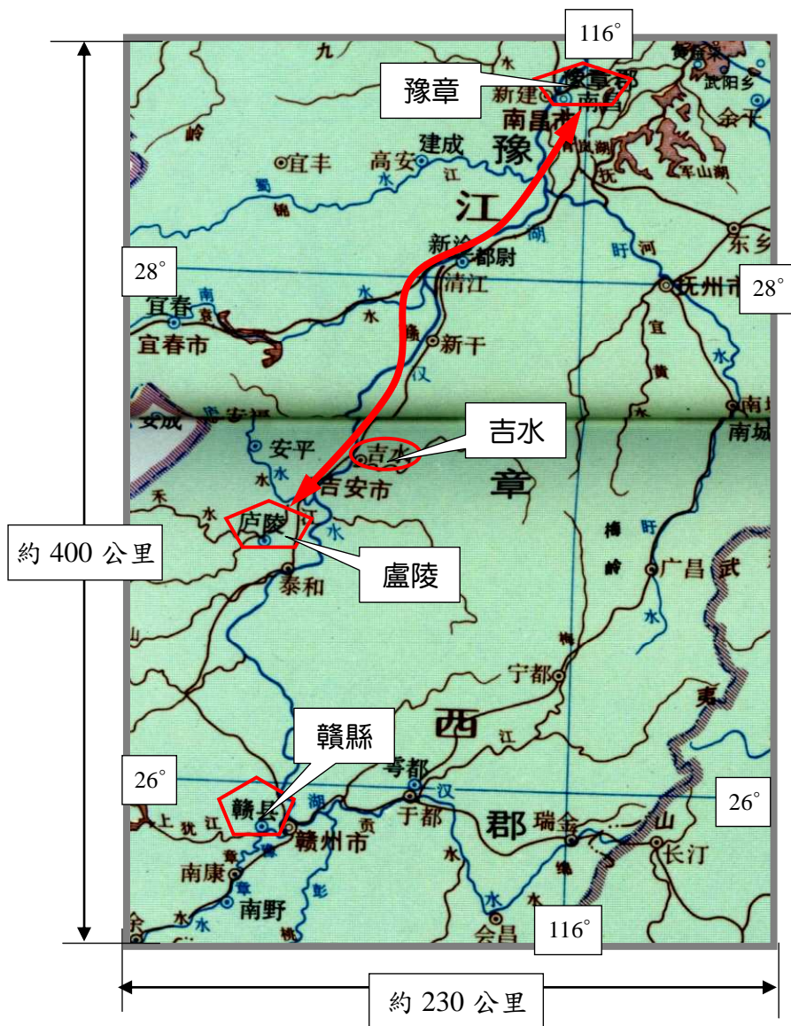
史地 3.41 挈族南遷終點：漢代豫章郡之盧陵吉水

舊譜記載，曾據於始建國庚午年（公元 10 年）十一月十一日挈族二千餘人南遷，家豫章盧陵之吉陽鄉，卒葬吉水仁壽鄉。以此推算，從廣陵揚州搭船，沿長江逆水而上，進入鄱陽湖的豫章郡（今南昌），再沿贛江（古稱豫章江）逆水到達盧陵（今吉安），全程約 700~800 公里，如以每日航行 20 公里推算，需約 40 多天，抵達盧陵上岸後，再向東行走約 20~30 公里，就是族譜記載的「吉陽鄉」，時間來到新年春節了。