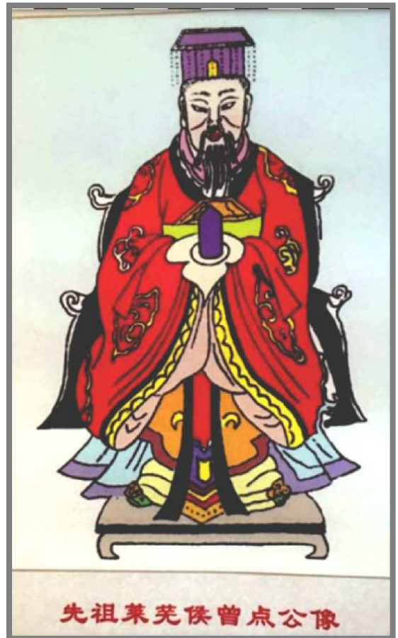
曾4世：前 500 曾點

這時魯國政局發生重大變化，魯昭公時(公元前 541-510 年)，三桓將魯國王室的土地財產、軍隊及人口瓜分，再由三桓進貢供養魯國君主。曾點乃從早先的貴族家庭，變為一介平民百姓，需靠自己從事農耕種植生產，生活相當辛苦。