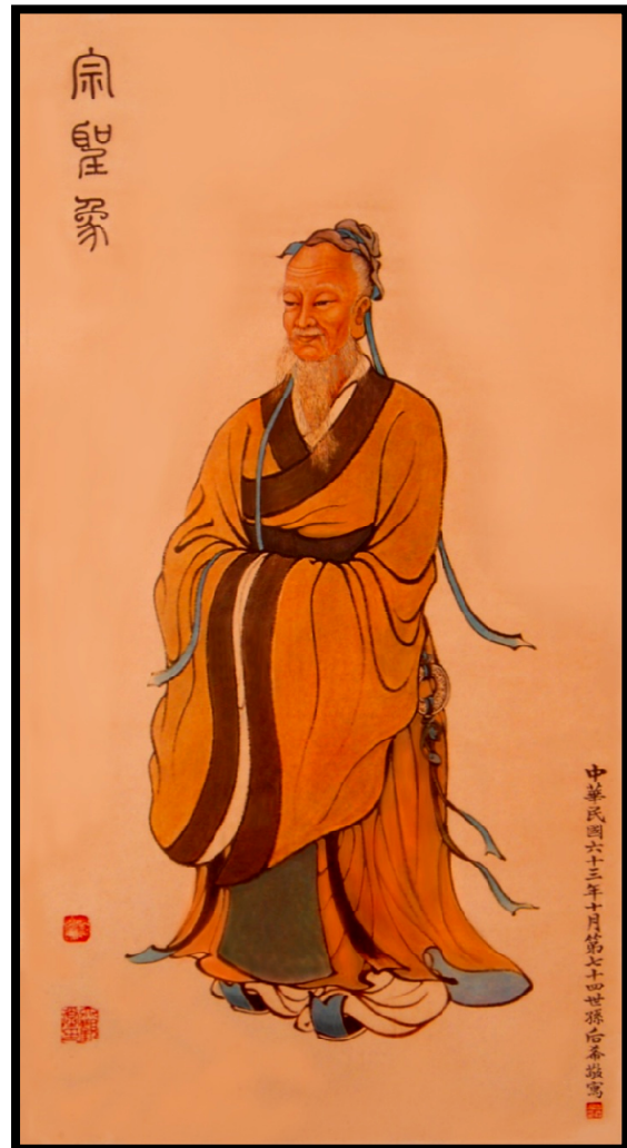
宗聖公武城 1 派：前 470 曾子 公元（前 505～435）年

曾參乃被尊稱為宗聖曾子。明嘉靖十二年（公元 1533 年），史部左侍郎，前翰林學士顧鼎臣奏，聖裁准照依孔、顏、孟事例，訪求曾氏子孫相應者一人，世襲翰林院五經博士，代代承襲，俾守曾子廟墓，以主祀事。據此，武城曾氏族譜敕封為宗聖族譜，以曾子為「武城開派始祖」。