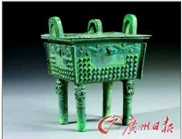
曾侯墓地出土青銅器

戰後噩國族人被分裂為三：一部分南逃成為後來楚國的東鄂土人，一部分西遷成為申國的私屬，還有一部分噩人連同部分國土被方城曾國兼併。這支南逃成為噩族人，後來落腳在漢江下游與長江會流之地，成為楚國東方的鄂國。