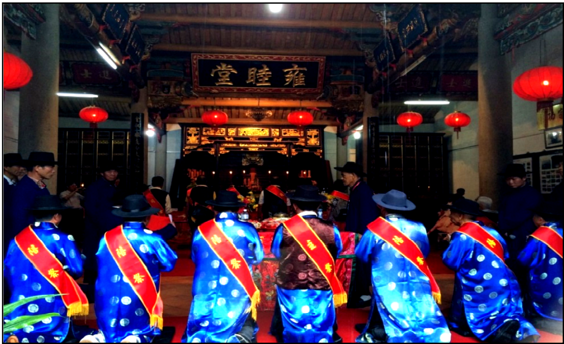
行三跪九叩謁祖古體

雍睦堂歷經明末兵變、發火、太平天國亂等毀壞，多次修復重建。文革期間受損，1994 年重修家廟至今。