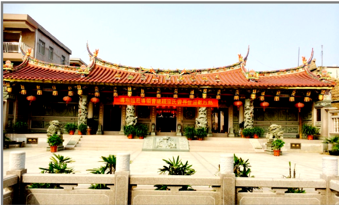
泉州官橋曾氏祠堂